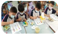
生活課 - 色彩的變化