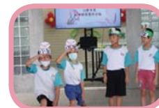
英語戲劇 - 小羊找媽媽