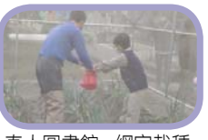
真人圖書館 - 網室栽種