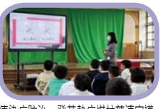
傳染病防治-登革熱病媒蚊清除宣導