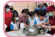
家政班阿姨指導分離蛋黃蛋白

感謝所有參與活動的家長、努力展現自己的學生以及背後默默指導的師長們，祝福土庫所有的家長與老師，母親節快樂！