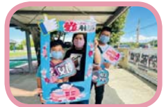
母親節打卡版拍照