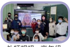
外師視訊 - 高年級