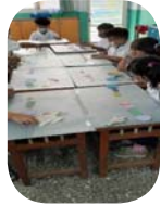
數學課 - 圖形規律性