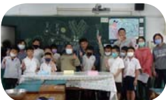
蔥明夢工廠開張大吉