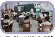
視力保健-結合閱讀課強化學生視力保健知識