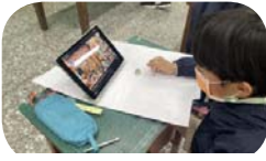
英文課 - 繪製 menu