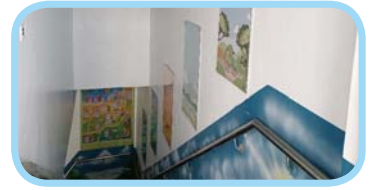
營造美感生態校園系統環境整建購置主題展示架