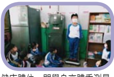
健康體位~開學身高體重測量