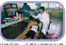
口腔保健~齒溝封填防蛀計畫