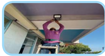
執行強化校園安全防護工作