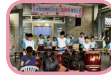
氣勢磅礴的太鼓開場