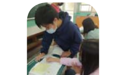
數學小老師一對一教學