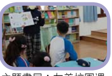
主題書展：友善校園週