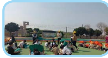
111 學年度下學期地震防災演練