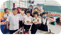
食農課程 - 小白菜大阪燒