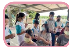
為媽媽獻上一杯茶水