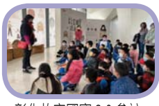
彰化故宮國寶 2.0 參訪