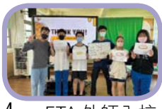
4 ETA 外師入校