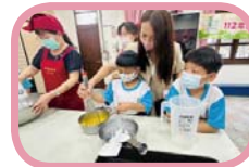
媽媽指導孩子攪拌蛋糕