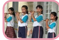
中國笛表演 - 桃花過渡