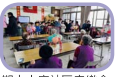
期末土庫社區音樂會