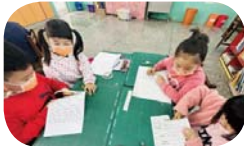
分組完成課文段落