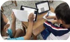
撰寫英文自我介紹