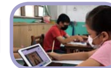
夏日樂學：話畫之坊