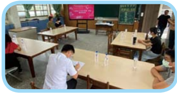
111 學年度期初線上家長會