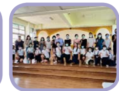
為師長獻上感恩的茶水與祝福，謝謝老師平日的辛勞