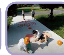
學生們繪製大型祝福海報