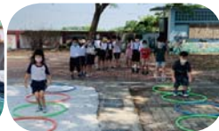
低年級體育課 - 呼拉圈競賽