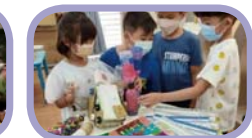
暑假作業暨剪報簿展覽