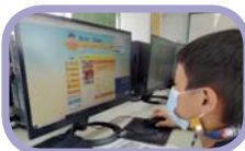
飛越雲端·線上認證