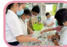
迎新闖關~拼圖狩獵