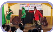
反毒巡迴劇團演出