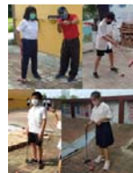
體育課 - 槌球練習