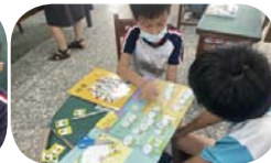
社會課 - 家庭成員大考驗