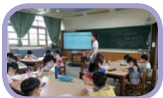
4 週三下午英語社團、英語歌謠