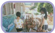
傳染病防治、學習環境清潔與消毒