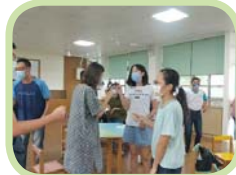
講師帶領家長一起進行破冰遊戲