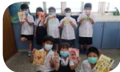
美勞課 -- 卡片製作