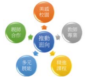
圖：土庫國小新學年校務經營推動主軸

優質的課程源於「滾動式的調整」，108課綱的推動，並在前輩校長的課程領導下，已建構良善的校訂課程模組，透過教師培力與教學領導，推動課程推動模式的調整，讓課程教學的執行更符合學生需要、時代趨勢。