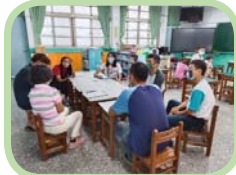
班親日 - 建立良好的親師管道