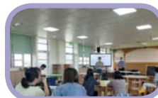
教師部分雙語精進研習