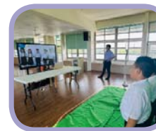
虛擬攝影棚錄製教師節祝福影片

今年教師節輔導室規劃了為期兩週的教師節活動，分為三個項目，其一是「愛的大聲說」，學生們在虛擬攝影棚錄製對師長的感謝語，再由佩嫻老師協助剪輯影片，在教師節當天播放給全校師長看；其二是「愛在土庫」，由繪畫社指導教師帶領繪畫社的學生，在各班教室前的步道上用粉筆繪製大型海報，再由空拍機拍下，作為教師節活動的祝福之一；其三是「猜猜我師誰」，輔導室每日公布三位師長兒童時期的照片，讓學生們去猜，猜對者有小禮物喔！在教師節活動當天還舉辦敬師奉茶活動，向平日裡努力教書的師長們奉上一杯溫暖的茶水，謝謝師長的用心教導。