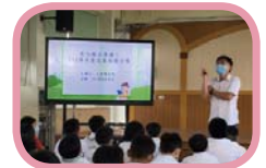
開學典禮~校長進行友善校園宣講