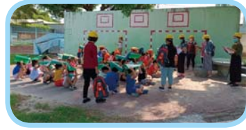
111 學年度上學期地震防災演練