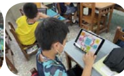
根據小花結構圖的提示構思