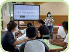
親職教育講座 - E 世代的親職挑戰