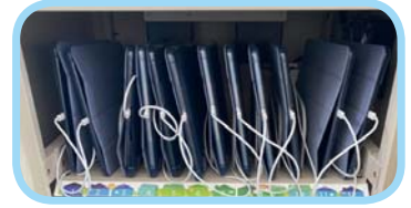
添購平板及充電車