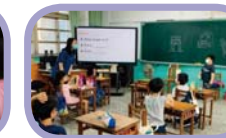
夏日樂學：英語課程