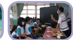
夏日樂學：木作之坊