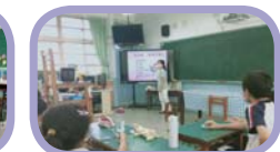
高年級生、心理衛教、認識青春期、與自己當好朋友