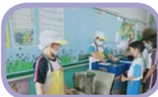
衛生飲食、裝備齊全合乎規定的打菜小幫手