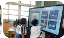
彈性課 - 我是環保小尖兵