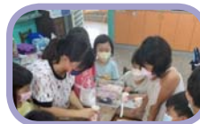
夏日樂學：香草之坊