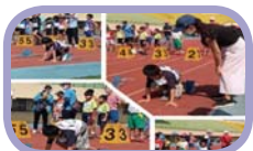
111 學年度縣長盃田徑比賽

迎接嶄新風貌的 111 學年度，本學年全校師生也都能一同回到校園、回歸正常的學習步調，學校也持續推動提供師生們更多元豐富的學習、展能的機會，孩子擴散學習經驗，各領域課程內所學，融會在實際生活中。於開學前學校便開始一系列的課程設計與規劃，讓孩子在各學科領域加深加廣，跨域學習、雙語教學持續扎根；食農結合科技教育，培育具新視野、科技化的土庫小青農；在戶外教育的計畫引進下，帶著全體師生背著行囊闖天下；閱讀寫作和藝術的深耕，讓校園「閱」音「樂」聲綿綿不絕；美感教育暨廣達游於藝的課程，提供孩子發光發熱的舞台，各各都能是口語流暢、肢體豐富的導覽小尖兵！在護理師的守護下，無論是健康保健、營養教育、急救知識、傳染病防治等學習也不馬虎，讓全校師生養成良好的衛生習慣，懂得保護自己與他人。