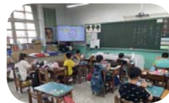
小花結構法寫作練習