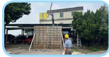
運動操場及周邊設施整建工程