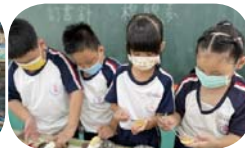
國語課 ~ 小小料理王 - 有趣好吃的盆盆大口