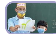
校長新生閱讀公開課