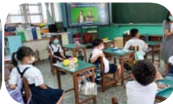
英語課 -- 聽音練習