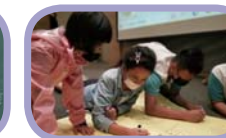
廣達小尖兵：國美館見學