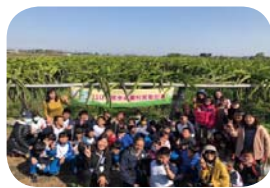
110 年度校本課程 - 小小青農 - 拜訪佳維農果園