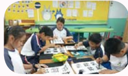
用台語學書法作品