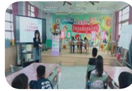
傳染病防治 - 腸病毒話劇演出