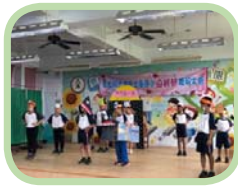
低年級可愛的唱跳表演