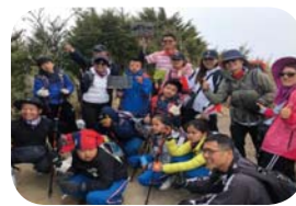
109 學年度戶外教育之玉山前峰攻頂