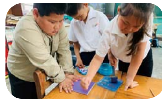
藝術光點版畫製作