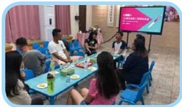
109 下學期家長會委員大會