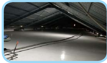
教學樓屋頂防水隔熱工程完工