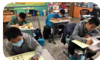
小組討論作者想表達的詩詞內容