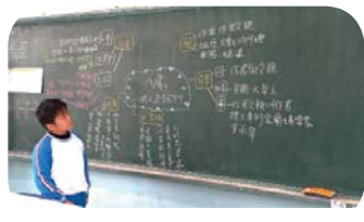
完成課文心智圖及試說大意