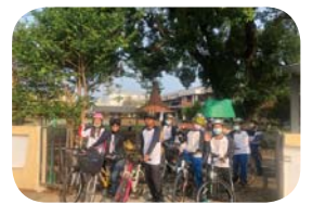
六年級畢業活動之一鐵騎環鄉之家鄉巡禮