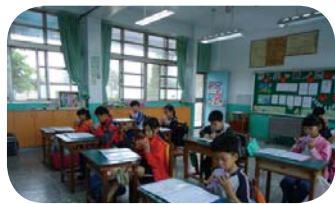
練習母親節活動曲目