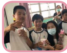
為親愛的媽媽奉上一杯感謝的茶水