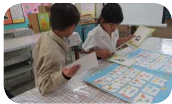
英語課 - 尋找字母