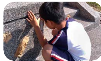
數學課實際測量司令台底座體積