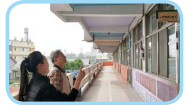
電力系統改善美感諮詢