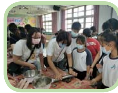
親子手作烤餅乾活動～充滿甜蜜的心意