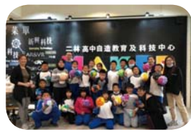
科技運用创客教育～二林高中自造教育中心雷雕紙藝課程