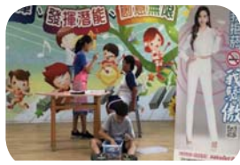
拒菸檳危害防治 - 拒菸檳話劇演出