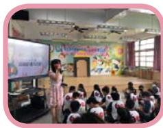
校長為母親節活動進行開場

此外，學校還規劃親子手作餅乾的活動，透過親師生一同合作，烤出一片充滿心意的餅乾，將心中滿滿的感恩，包含在一片片的餅乾裡，送給平日辛苦照顧自己的家長與老師，祝福所有家長及老師母親節快樂！