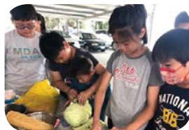
健康體位 - 健康、營養菜單設計與實作