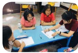
教師研習～各年段教師沈浸式英語教學分享