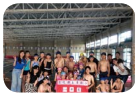
109 學年度第一次游泳課