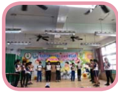
中年級吹奏美麗的康乃馨獻給媽媽