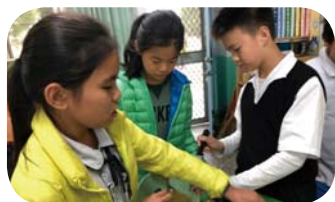
配合國語課文 - 最好味覺的禮物~ 自己動手做果汁！