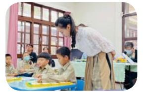
打開課室，不同的課堂風景～低年級沈浸式英語教學專家入校觀課