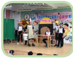
高年級用戲劇表達對家長的愛