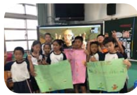
英語外師視訊教學～無遠弗屆的網際網路讓孩子每月最期待與麥克爺上課