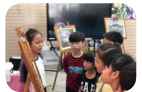
藝術光點攜手計畫～行動美術館，在學校就能浸潤在藝術殿堂