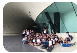
藝起來尋美～高雄衛武營管風琴音樂饗宴