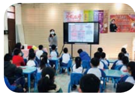
傳染病防治 - 開學防疫宣導