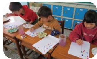
生活課 - 色彩好好玩