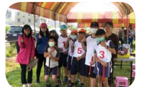
109 學年度教育盃槌球比賽

109 學年度即將邁入尾聲，土庫的 36 位小勇士在努力的學習和師長的引導下，在各領域及科技、食農、戶外教育裡收穫滿滿，更發揮所長代表學校獲得不少優異成績與好表現，懂得挑戰未知，創造不平凡的校園生活！教師們也不惶多讓，為了未來的雙語教學提前自我精進、跨領域課程拓展，準備給學生們更多元豐富且具國際視野的學習內容。與每個人息息相關的營養知識、防疫、菸檳危害宣導等多樣健康議題，透過有趣的話劇、菜單設計實作等活動，讓師生快樂學習的同時也懂得保護你我的健康。