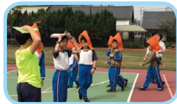
每學期舉辦地震防災演練