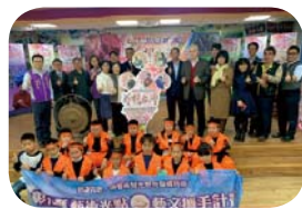
110 年度藝術光點開幕之本校太鼓表演。