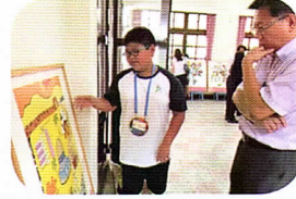
廣達遊藝藝文文化部藝拍即合計畫～妮基的異想世界展覽，學生化身為導覽小尖兵。