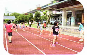
健康體位～大家一起來運動。