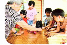
老幼共食～和社區長輩玩桌遊