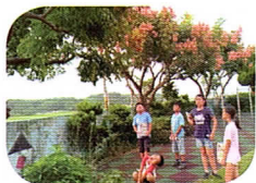
觀察國語課文中提到的台灣欒樹