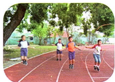
體育課我們一起練習跳繩