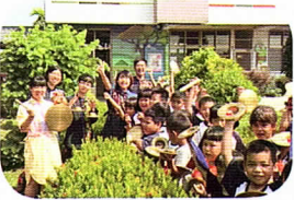
廟口扮仙趣～圓仔花北管樂團入校指導學生