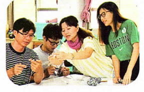
假日親子共學～手作編織