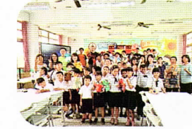
紅盒子布袋戲到校服務