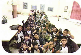
特有生物中心～我愛台灣黑熊