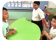
數學好好玩桌遊因數心臟病