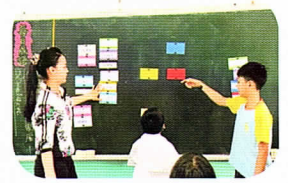
經典闖關教學活動，以桌遊型式評量成果。