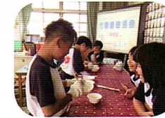
彈性課—代間體驗活動