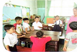
口腔保健～含氟漱口口水漱口～讓牙齒更健康。