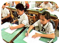
每課國語課後—生字賓果競賽