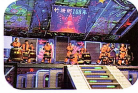
中秋太鼓聯歡晚會