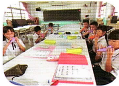
陶笛課—第一次上陶笛課