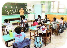
健康課—飲食紅綠燈