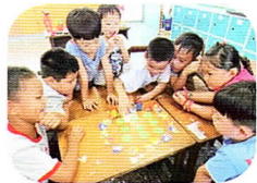
桌遊好好玩—拔雞毛