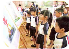
藝文課—參觀妮基畫展