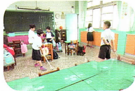
傳染病防治～教室清潔消毒，預防傳染病傳播。

在生活情境當中活用所學，內化為帶得走的能力，厚積素養，是我們努力方向。108 年度引進教育部、師大、農委會、縣政府、竹塘鄉四健會、竹塘鄉公所補助、劉昭崇老師大愛媽媽讀經團隊、佛光山雲水書車、研揚文教基金會、廣達文教基金會、兒童福利聯盟、張君雅文教基金會、元大文教基金會、台大社工系與台大牙醫系等等，共構學校的在地特色課程與教學。除此，學生基本學力、生活教育、體育及衛生教育、是我們日常的重點。在全體教職員工對教導處的協助與對學校教育的努力下，期許學子有健康的身心靈並具終身學習的能力，開創無限的可能。